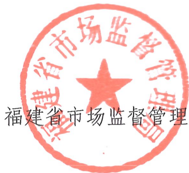
福建省市场监督管理局

根据市场监管总局等部门《关于印发 2021 网络市场监管专项行动（网剑行动）方案的通知》（国市监网监发〔2021〕50 号）要求，省市场监管局、省委宣传部、省网信办、省公安厅、省商务厅、省文旅厅、省林业局、省药监局、省通信管理局、省邮政管理局、人民银行福州中心支行、福州海关、厦门海关、国家税务总局福建省税务局等部门决定于 2021 年 10 月至 12 月中旬联合开展 2021 网络市场监管专项行动（网剑行动），并制定了《福建省 2021 网络市场监管专项行动（网剑行动）实施方案》。现将该实施方案印发给你们，请结合实际认真贯彻执行。