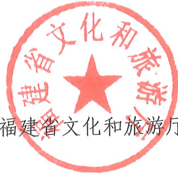
福建省文化和旅游厅