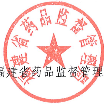
福建省药品监督管理局