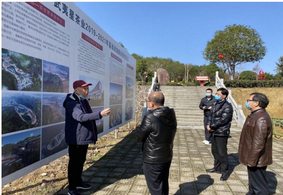
武夷山市委市政府有关单位莅临公司指导防控疫情工作

复工当日，武夷山市委副书记、市政府市长谢启龙带领市政府有关单位来到公司询问复工期间遇到的困难情况，解企业之困，共渡这场疫情防控战役。