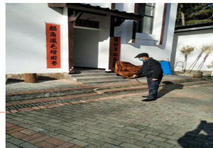
厂区人员日常防疫消杀